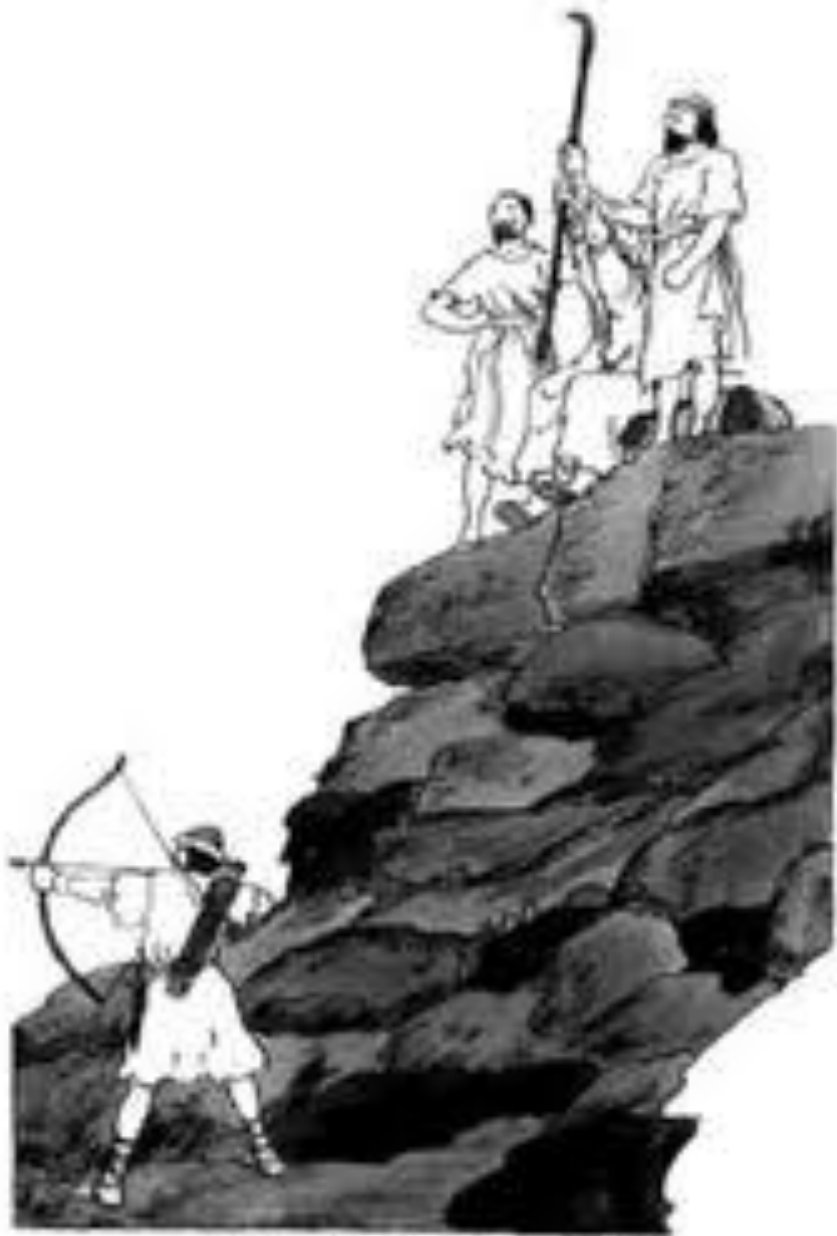
亞倫和戶珥扶著摩西的雙手